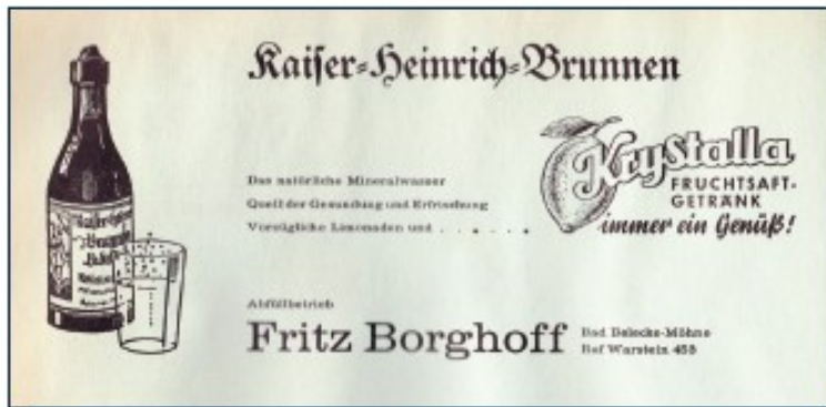
Werbeanzeige aus dem Jahre 1962.

lungssuchend nach Belecke zu kommen und bei uns im Heim zu wohnen, das wir für diesen Zweck eigens einrichten.“ (Heerbann Christi, 10. Jg., Nr. 1, 1934)