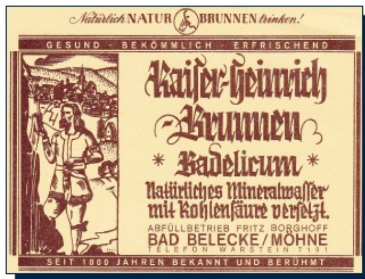
Flaschenetikett des „Belecker Wassers“.

Unter der Führung von Caspar Bracht, der selbst als Lehrer im Klemensheim wirkte, bohrten Belecker Männer, zumeist Kolpingbrüder, ab Oktober 1932 nach dem neuen Lauf der Heilquelle und entdeckten in der Nähe des heutigen Standorts eine lohnenswerte Erschließungsmöglichkeit. Unter dem Dach des 1934 gegründeten Verkehrsvereins wurde ein neues Badehaus erbaut. Unter anderem sorgte die NS-Organisation „Kraft durch Freude“ bis zum Krieg für die Zuführung von Badegästen aus dem weiteren Umland. Erst 1954 wurde ein rechtsverbindlicher Pachtvertrag zwischen der Stadt Belecke und der Bade- und Brunnenverwaltung als gemeinnützigem Verein geschlossen und diesem das Gelände mit Kaiser-Heinrich-Quelle, Ba-