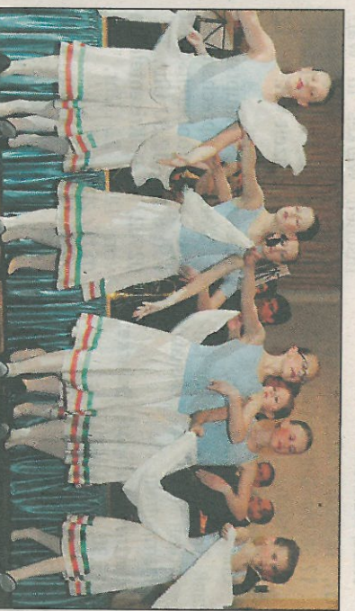
Die Tanz-Arbeitsgemeinschaften der vierten und der dritten Klassen der Westbergschule präsentierten gestern ihre einstudierten Tanzdarbietungen.