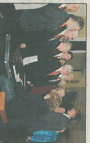
„Wann wird's mal wieder richtig Sommer?“, fragte der Gemischte Chor.